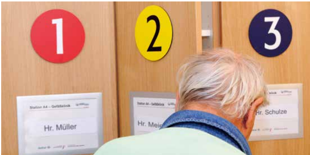
Ausnahmesituation Krankenhaus: Klare Kennzeichnungen helfen dabei, sich zurechtzufinden.

TEXT Dr. Peter Stuckhard // FOTO Manuel Bünemann