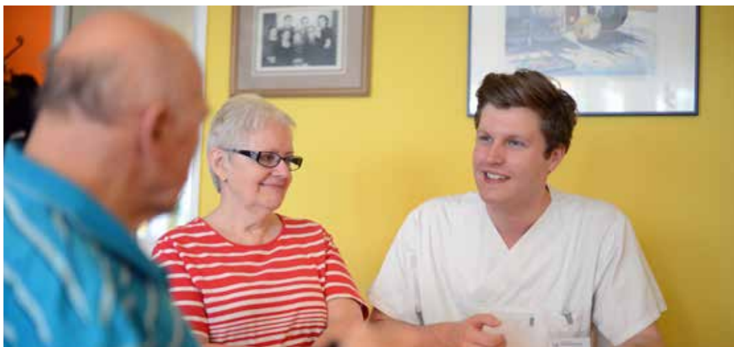
Geborgenheit im Mittelpunkt: Bei der Pflege gibt es einige Besonderheiten zu beachten.

Die Diagnose Demenz ist für Erkrankte und Angehörige doch häufig ein Schock?