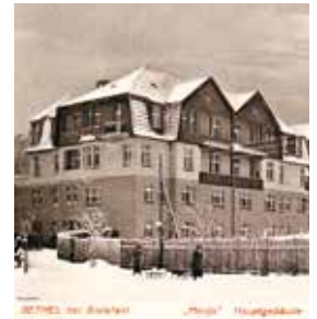
Haus Gilead IV: Historische Aufnahme aus dem Jahr 1915.

Aber das ist Notsituationen vorbehalten. Die Eventualitäten eines möglichen Rückfalls können in einer Behandlungsvereinbarung (lesen Sie hierzu auch den Artikel auf Seite 40) geklärt werden, die dem Behandlungsteam wie den Patienten die auch rechtliche Sicherheit einer Patientenverfügung verleiht. Die moderne Psychiatrie und Psychotherapie ist aufgeschlossen, in der Gemeinde vernetzt und setzt auf wirksame Therapien, sie begegnet den Patienten respektvoll und auf Augenhöhe.