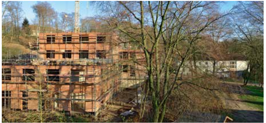
Reha-Neubau: Direkt neben der bisherigen Klinik.

Nach umfangreichen und aussagekräftigen Tests geht es in der medizinisch-beruflichen Rehabilitation auch darum, praktisch zu trainieren. Wichtig ist ein Bewerbungstraining mit dem Wissen, an Epilepsie erkrankt zu sein. „Bei uns wird auch – wenn erforderlich – ganz konkret gearbeitet. Unter realen Arbeitsbedingungen in den Betrieben Bethels oder in anderen Bielefelder Unternehmen führen wir Belastungserprobungen durch“, erklärt Specht, der mit seinem Team in der ein- bis dreiwöchigen Phase in Unternehmen mit den Rehabilitanden erkennt, wie leistungsfähig und belastbar sie sind. Je nach Vorbildung und Interesse wird beispielsweise im Büro gearbeitet, im Vertrieb oder in der Produktion. „Die Auswahl der Berufe ist ein wichtiger Punkt. Ein Dachdecker mit